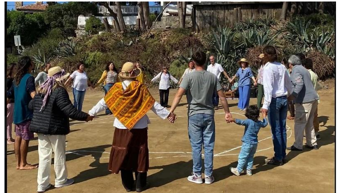
ZAPALLAR - CHILE