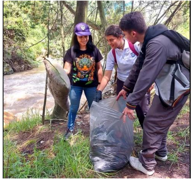
RIO FUCHA - BOGOTÁ