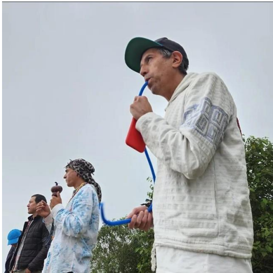
LAGUNA DE TENANSUCA - CUNDINAMARCA