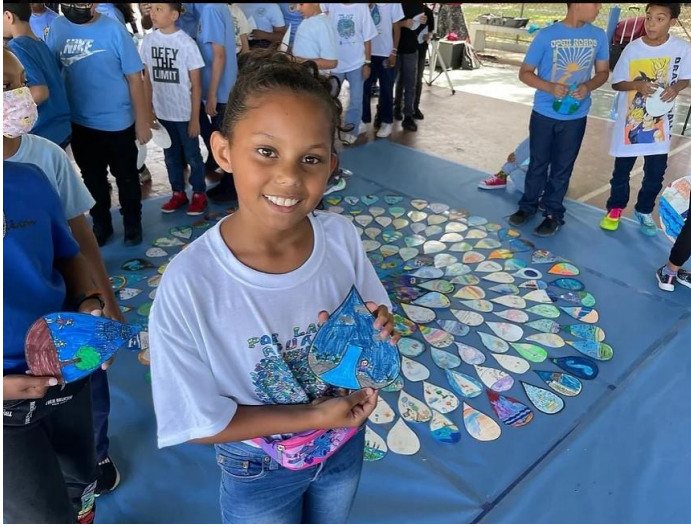
SAN JUAN DE PUERTO RICO